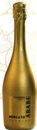
ÁRABE MOSCATO ● BLANCO PREMIUM