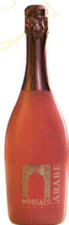
ÁRABE MOSCATO ● ROSADO PREMIUM